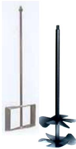
Scheiben-Rührer Disc Stirrer