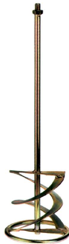
Wendel-Rührer Helicon Ribbon Stirrer