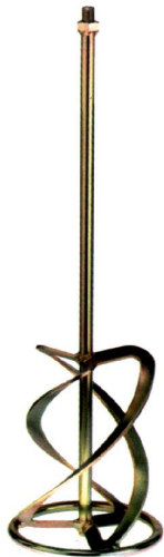
Mörtel-Rührer Mortar Stirrer